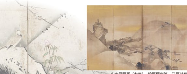
山水図屏風(左隻) 狩野探幽筆 江戸時代 17世紀 京都・長福寺(通期展示)