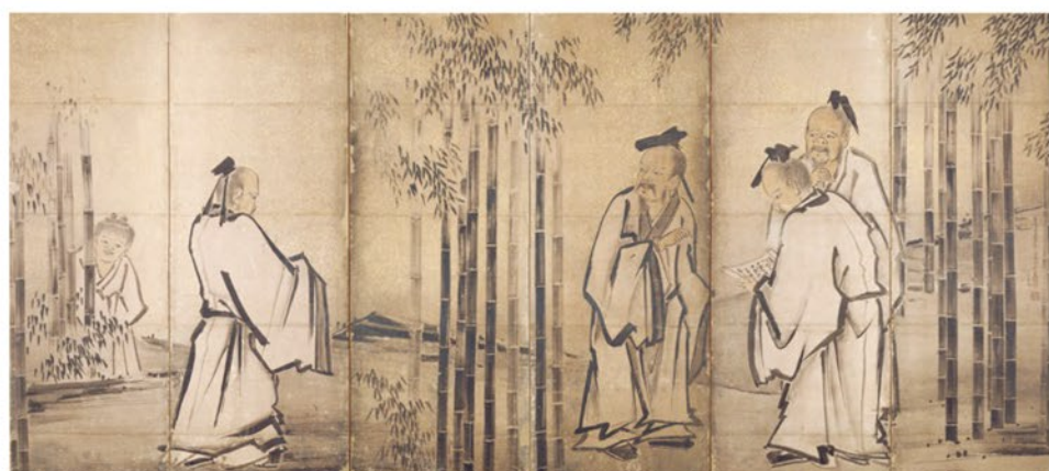
竹林七賢図屏風(右隻) 長谷川等伯筆 桃山時代 慶長12年(1607) 京都・両足院(通期展示)