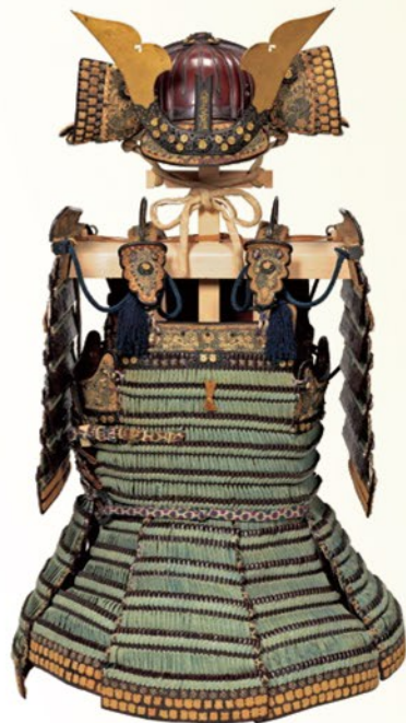
重要文化財 縹糸威胴丸 京都国立博物館