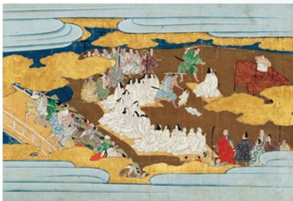
秀次公縁起(部分) 京都・瑞泉寺