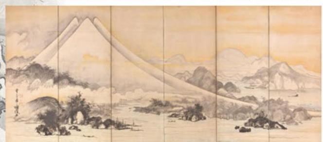
富士三保図屏風(左隻) 曾我蕭白筆 江戸時代 18世紀 滋賀・MIHO MUSEUM(通期展示)