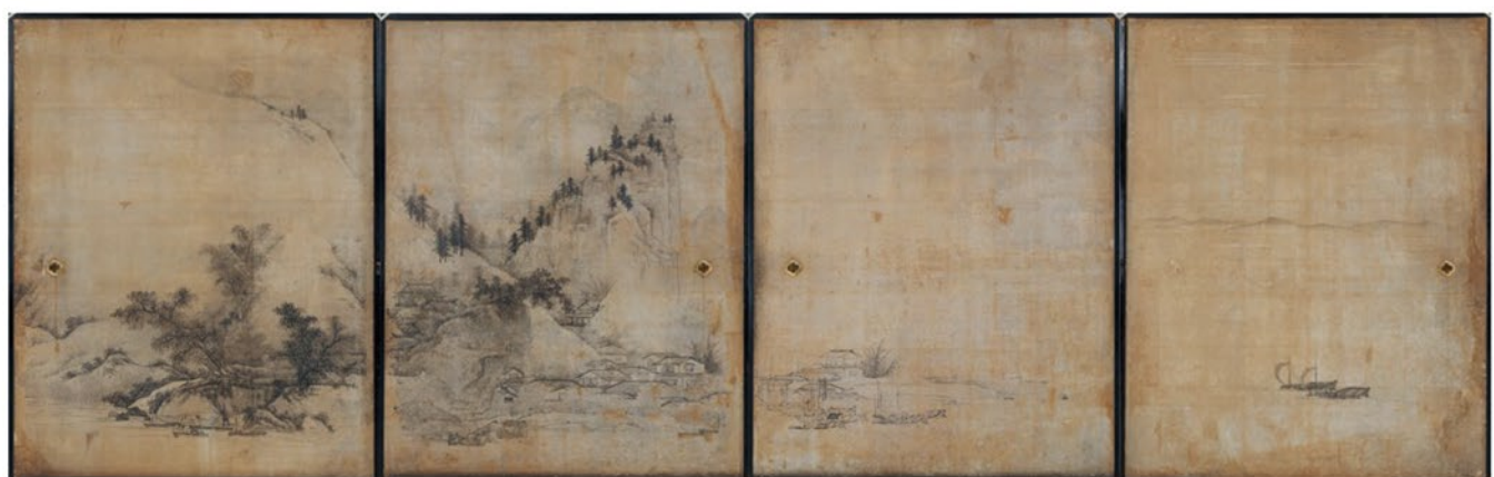
重要文化財 山水図横 雲谷等顔筆 桃山時代 16～17世紀 京都・黄梅院(通期展示)