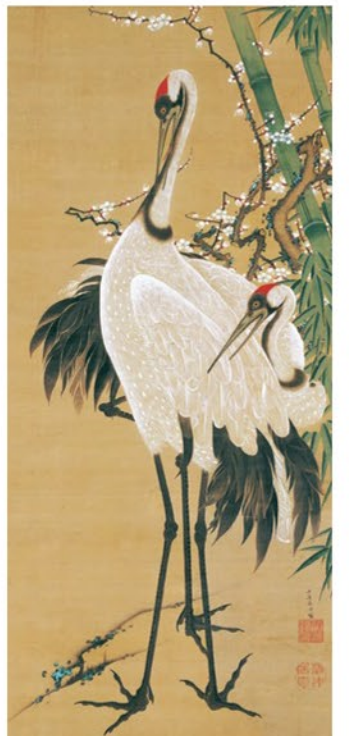
竹梅双鶴図 伊藤若冲筆 江戸時代 18世紀 東京・出光美術館(4月30日～5月26日展示)