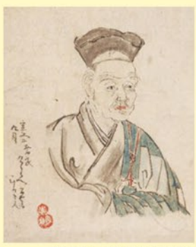
探幽繪圖 雪舟筆自画像模本 狩野探幽筆 江戸時代 寛文2年(1662) 京都国立博物館(通期展示)

やがて周防(現在の山口県)に下り大内氏の庇護を得ると、応仁元年(一四六七)には遣明使節の一員に加わり入明を果たしています。足掛け三年に及ぶ在明のち帰国したあとは、はじめ豊後(現在の大分県)、のち再び周防を主な拠点としながら旅を重ね、宋元画を学んだ幅広い画風と骨太で力強い筆墨に特色ある作品を残しました。