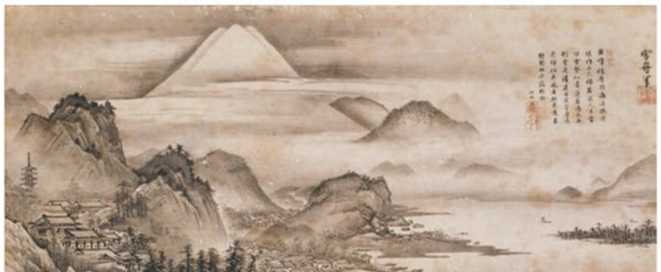
富士三保清見寺図 伝雪舟筆 室町時代 16世紀 東京・永青文庫(通期展示)