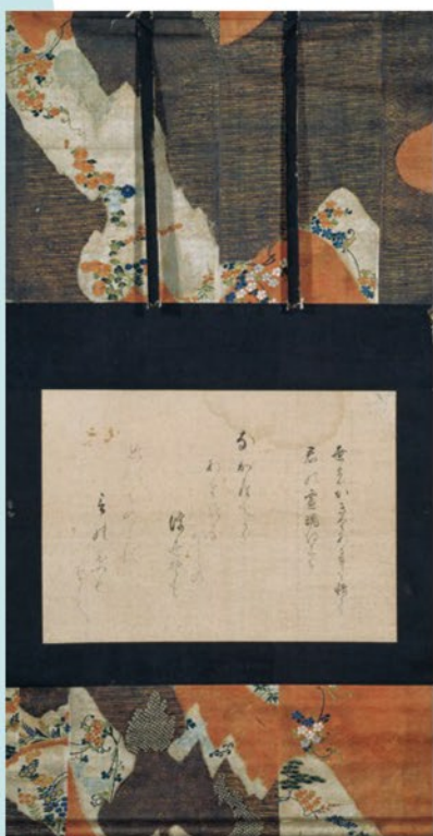
一の臺 辞世和歌 京都・瑞泉寺

秀次の四三〇回忌にあたる当年、瑞泉寺が所蔵する作品を通して秀次とその一族を偲ぶとともに、瑞泉寺の寺宝を紹介します。(山川 曉)