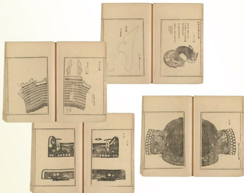
『集古十種』(部分) ※『集古十種』の展示はありません。