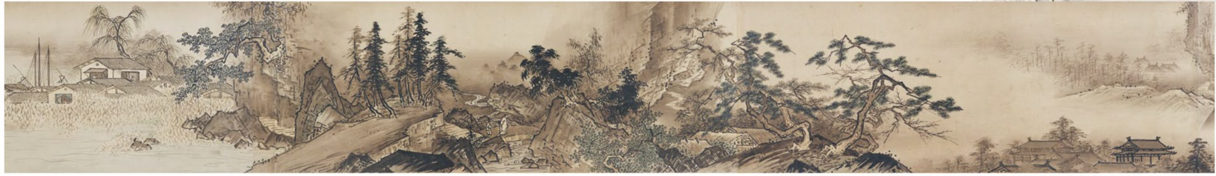
国宝 四季山水図巻(山水長巻)(部分) 雪舟筆 室町時代 文明18年(1486) 山口・毛利博物館(通期展示、巻替あり)