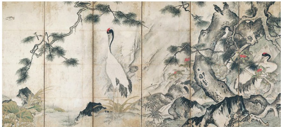
重要文化財 四季花鳥図屏風(右隻) 雪舟筆 室町時代 15世紀 京都国立博物館(通期展示)