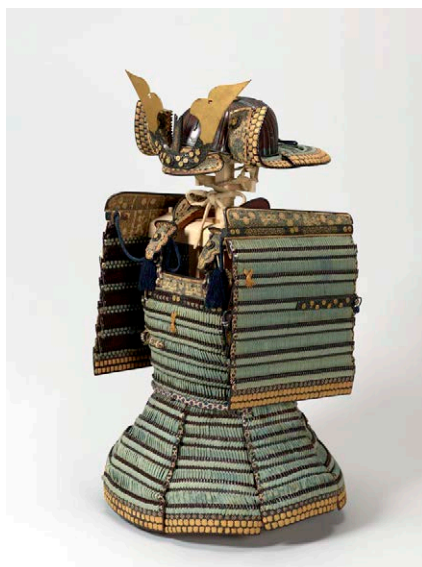
《重要文化財 縹糸威胴丸 京都国立博物館》

このたびはバンク・オブ・アメリカの助成により修理が完成したことを記念して特別公開いたします。