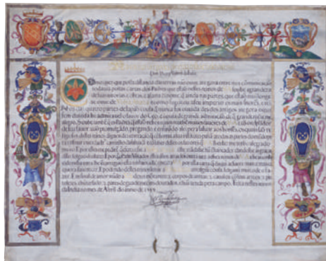
일본과 서양의 교류를 말해주는 국보

중국 등 대륙에서 전해진 그림과 글씨가 많으나, 그 가운데에는 머나먼 서양과의 관계를 전하는 국보도 있습니다.