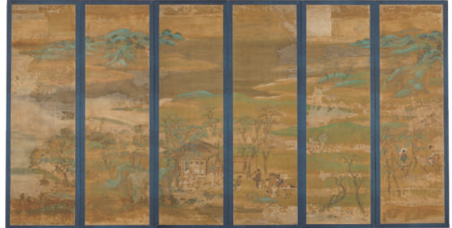
제2차 세계대전 이후 최초로 지정된 국보 중 하나

건축물, 글씨, 그림, 조각, 공예품, 역사 자료 등 여러 분야의 국보가 있습니다.