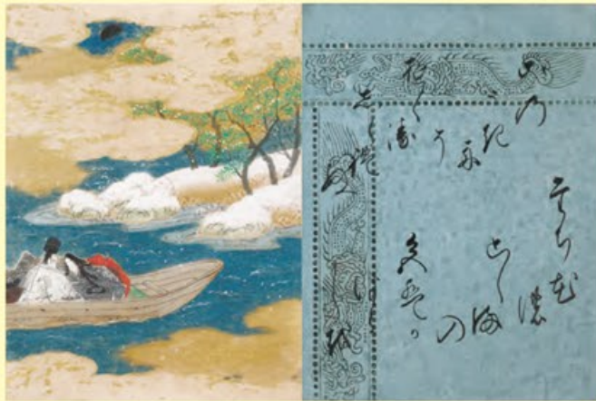
源氏物語画帖 第51帖「浮舟」 土佐光信筆 室町時代・永正6年(1509) アメリカ・ハーバード美術館/アーサー・M・サックラー美術館蔵 Bequest of the Hofer Collection of the Arts of Asia, 1985.352.51.A-B 宮廷絵所預・土佐光信による繊細、耽美、そして華麗な源氏絵が里帰り 京都 東京