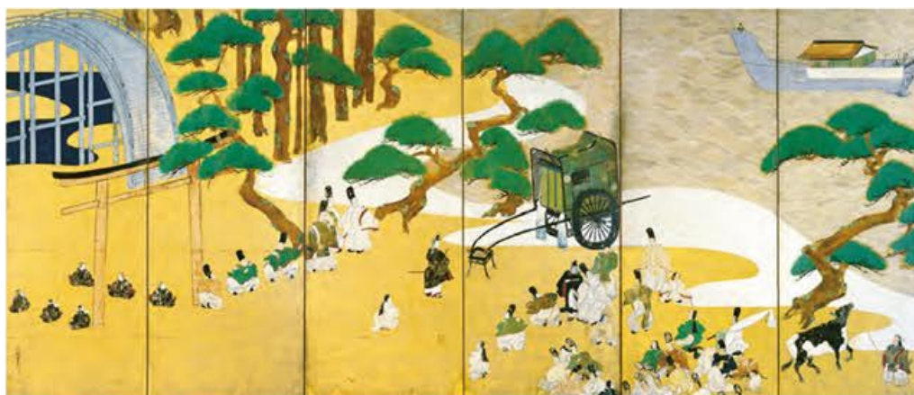
【国宝】源氏物語関屋澗標図屏風 倭屋宗達筆 江戸時代・寛永8年(1631) 東京・静嘉堂文庫美術館蔵 京都 東京 伝統的な源氏絵を大胆にデフォルメした近世源氏絵の最高峰