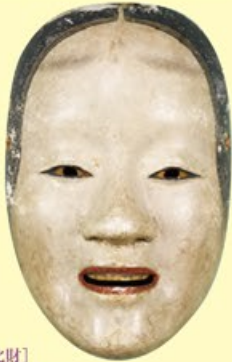
〔重要文化財〕 能面 泥眼 「天下一河内」 焼印 江戸時代・17世紀 東京国立博物館蔵 京都 光源氏への妄執により生霊となった六条御 息所は、こうした能面で表現されました