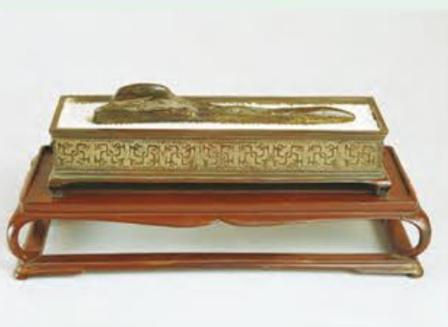
盆石 銘 夢浮橋 伝後醍醐天皇所用 南北朝時代・14世紀 愛知・徳川美術館蔵 源氏物語の最終帖「夢浮橋」の銘は後醍醐天皇による命名と伝わります 東京