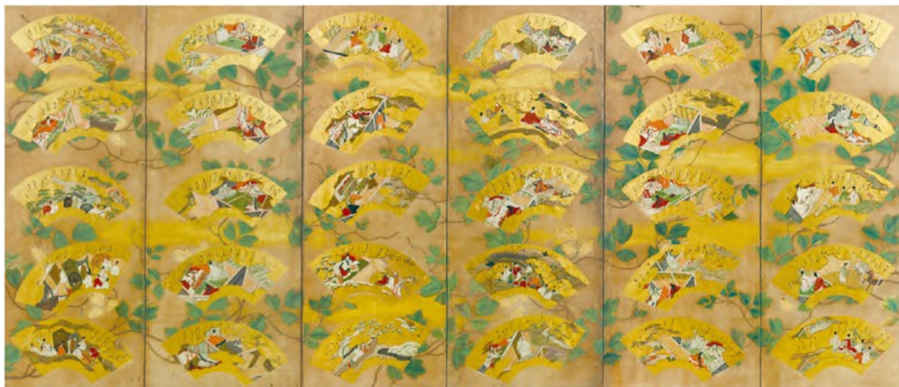
源氏物語図扇面貼交屏風(左隻)