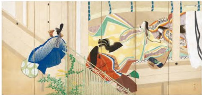
宇治の宮の姫君たち(右隻) 松岡映丘筆 大正元年(1912) 兵庫・姫路市立美術館蔵 国宝「源氏物語絵巻」の世界を鮮やかによみがえらせた、近代源氏絵の傑作