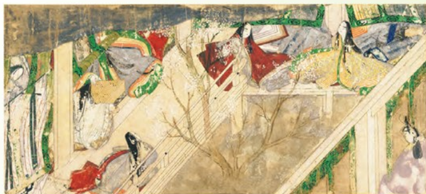
〔国宝〕源氏物語絵巻 竹河二 平安時代・12世紀 愛知・徳川美術館蔵 東京