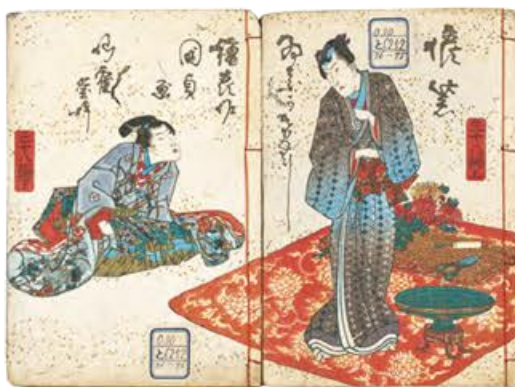
修紫田舎源氏 柳亭種彦作・歌川国貞(三代豊国)画 江戸時代・文政12~天保13年(1829~42) 東京国立博物館蔵 京都 東京 光源氏ならぬ、足利光氏の栄華を描いた大人気・長編パロディ小説

出版文化の発達とともに、「源氏物語」は江戸のひととに広く親しまれる物語となりました。登場人物や場面を当世風俗に置き換えて楽しむ浮世絵が数多く生まれ、知的な読み解きの遊びが広がります。江戸時代後期には、翻案小説「修紫田舎源氏」が大ベストセラーとなり、主人公・足利光氏を描く源氏絵が人気を博しました。この「源氏ブーム」は江戸後期の出版界を大きく動かし、その勢いは明治の浮世絵へも引き継がれていきます。