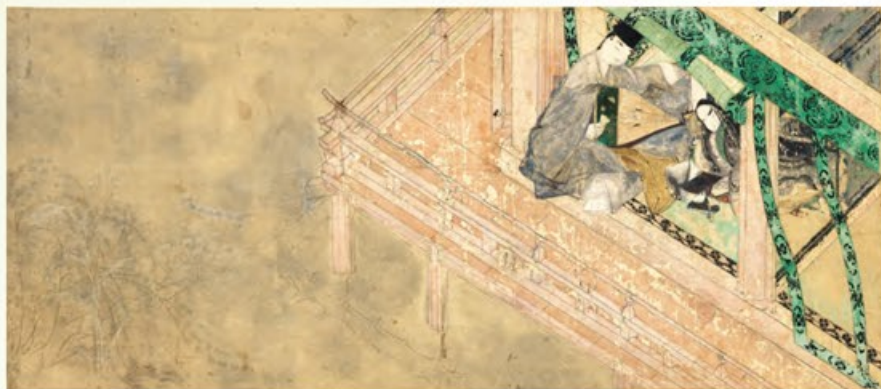
〔国宝〕源氏物語絵巻 宿木三 平安時代・12世紀 愛知・徳川美術館蔵 © 徳川美術館イメージアーカイブ/DNPartcom 京都