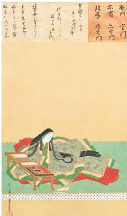
紫式部像 土佐光起筆 江戸時代・17世紀 滋賀・石山寺蔵 宮廷絵師・土佐光起が描いた、もっとも有名な紫式部の肖像画 京都 東京