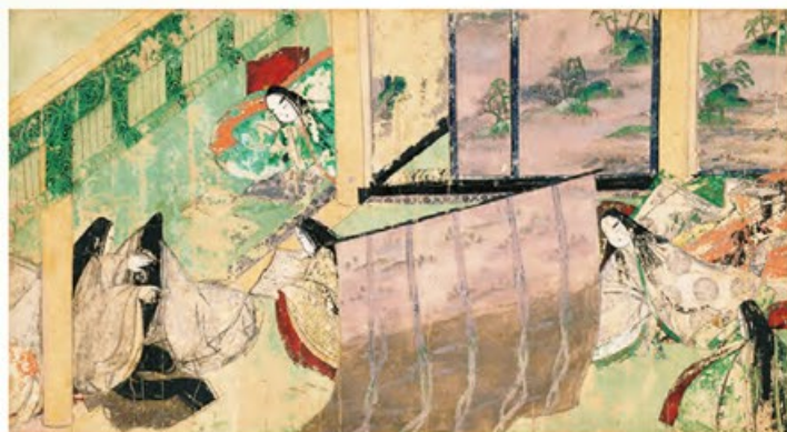
〔国宝〕源氏物語絵巻 東屋一 平安時代・12世紀 愛知・徳川美術館蔵 東京