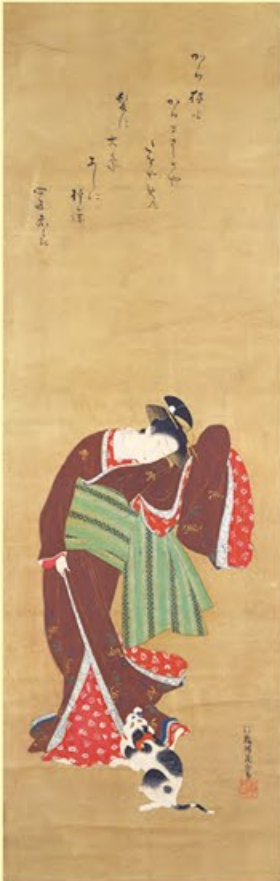
美人愛猫図 樋田湖庵筆 江戸時代・天明年間(1781~89)頃 東京国立博物館蔵 猫がじゃれつく美人画は、猫がめくった御簾から 姿を見せる「若菜上」の女三宮を連想させます 東京