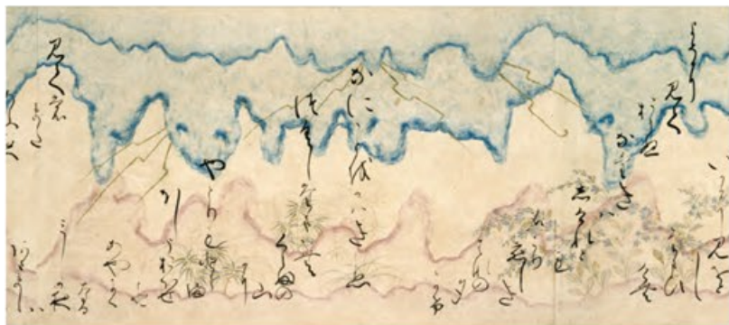
〔重要文化財〕源氏物語抜書(部分) 伝伏見天皇宸翰