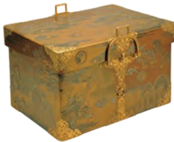
〔国宝〕初音の調度のうち 胡蝶蒔絵扶箱