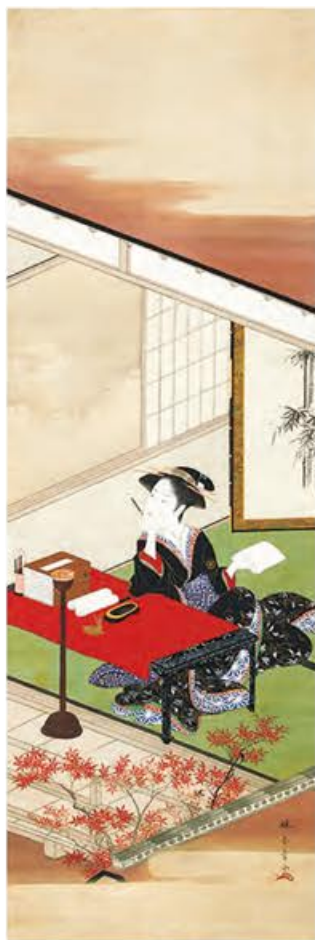
【重要文化財】雪月花図(月図) 勝川春章筆 江戸時代・天明7~8年(1787~88)頃 静岡・MOA美術館蔵 石山寺で筆を執る紫式部を、江戸の女性に置き換えた遊び心あふれる美人画 東京