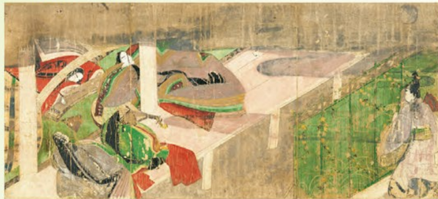
〔国宝〕源氏物語絵巻 橋姫 平安時代・12世紀 愛知・徳川美術館蔵 © 徳川美術館イメージアーカイブ/DNPartcom 京都