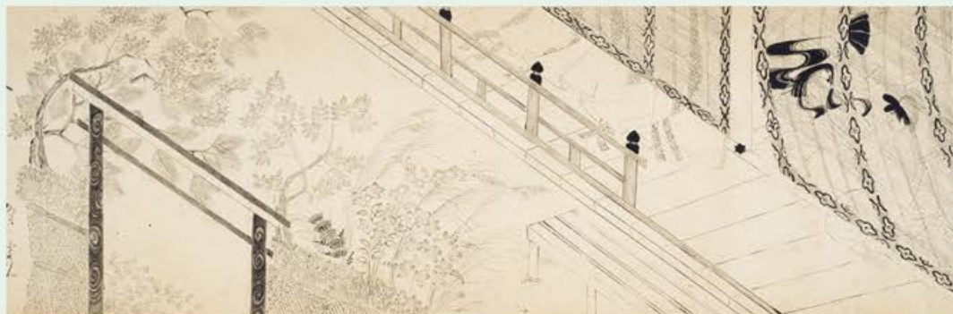
白描源氏物語歌合絵巻 室町時代・16世紀 いくつかの白描源氏絵は女性が描いた可能性も指摘されます 京都 東京