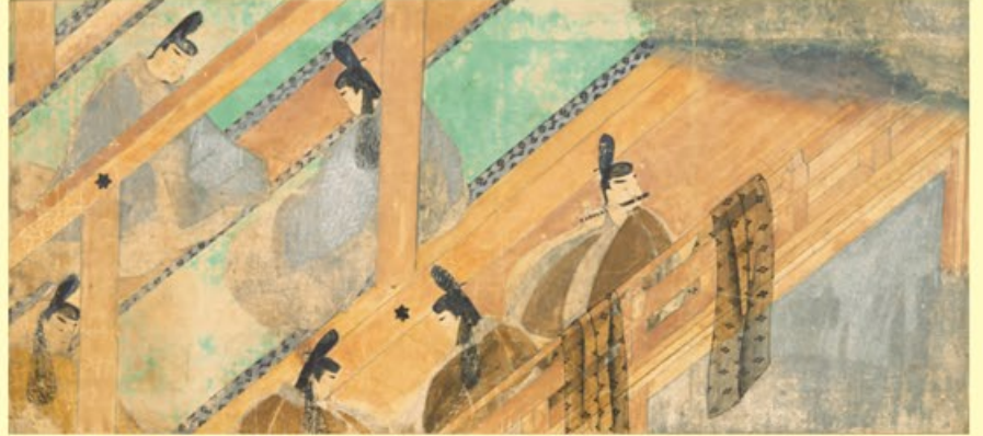
〔国宝〕源氏物語絵巻 鈴虫二 平安時代・12世紀 東京・五島美術館蔵 冷泉院、源氏、夕霧を鏡写しのように表現し、父子の関係を暗示します 京都