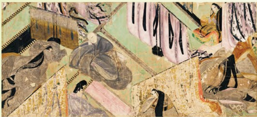
〔国宝〕源氏物語絵巻 柏木一 平安時代・12世紀 愛知・徳川美術館蔵 京都