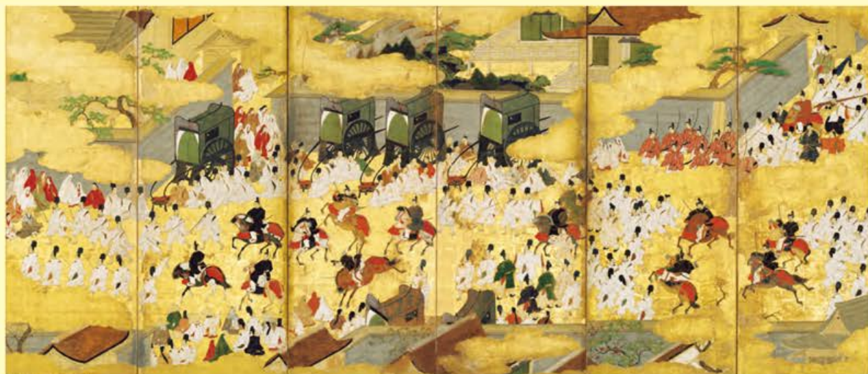
戦国時代の新しい源氏絵

見どころ1 京博では約50年ぶり、東博では初の「源氏物語展」 王朝文化の象徴『源氏物語』にかかわる美術の名品が大集結！