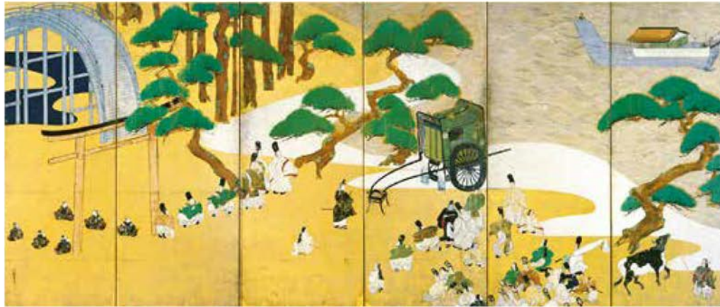
〔国宝〕源氏物語関屋落標図屏風 俵屋宗達筆 江戸時代・寛永8年(1631) 東京・静嘉堂文庫美術館蔵 (公財)静嘉堂/DNPartcom 京都 東京 伝統的な源氏絵を大胆にデフォルメした近世源氏絵の最高峰