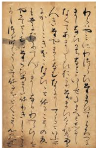
源氏物語(定家本) 若紫 鎌倉時代・13世紀 鎌倉時代の歌人で文学研究者でもあった藤原定家が関与した、本文研究上の重要写本 京都 東京