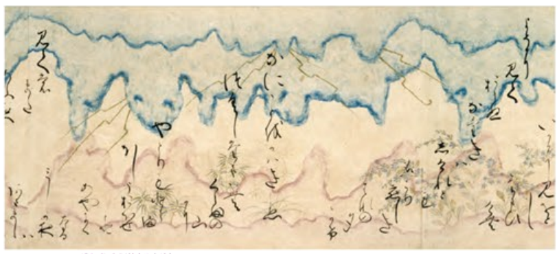
〔重要文化財〕源氏物語抜書（部分） 伝伏見天皇宸翰

鎌倉～南北朝時代・14世紀 千葉・国立歴史民俗博物館蔵 金銀泥絵を施した豪華な料紙下絵と流麗な書のコラボレーション 京都 東京