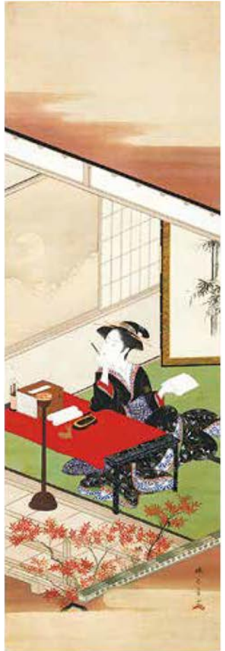
〔重要文化財〕雪月花図(月図) 勝川春章筆 江戸時代・天明7～8年(1787～88)頃 静岡・MOA美術館蔵 石山寺で筆を執る紫式部を、江戸の女性に置き換えた遊び心あふれる美人画 東京