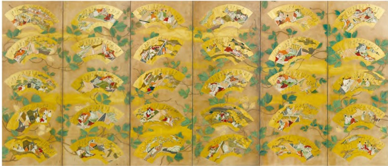
源氏物語図扇面貼交屏風（左隻） 室町時代・16世紀 広島・浄土寺蔵 60面もの源氏絵扇面を四季の順に貼り交ぜた、機知に富む作品 京都 東京

「源氏物語」は工芸品を裝飾する意匠としても表されました。その際には、人物の姿などを描かずに、特定の場面を暗示するモチーフを用いて象徴的に表す場合があります。これを留守文様といいます。また「源氏物語」が教養書として広まると、公家や武家が婚礼をおこなう際には「源氏物語」を携えて奥入れするようになり、その冊子を保管する書篋筒が制作され、婚礼調度に「源氏物語」の意匠を表すことがおこなわれました。