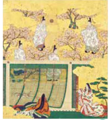
若菜上 東京 〔重要文化財〕源氏物語画帖 土佐光吉・長次郎筆 安土桃山～江戸時代・17世紀 京都国立博物館蔵 後陽成天皇をはじめとする宮中が総力を結集した、近世源氏絵の金字塔