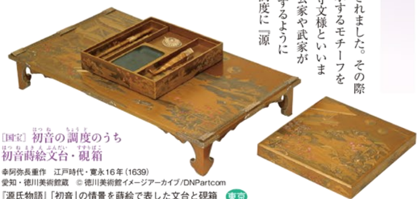
〔国宝〕初音の調度のうち 初音蒔絵文台・硯箱 幸阿弥長重作 江戸時代・寛永16年(1639) 愛知・徳川美術館蔵 『源氏物語』初音の情景を蒔絵で表した文台と硯箱 東京

◆源氏物語と能 王朝文化の象徴である「源氏物語」と、幽玄の美意識に基づいた能とは、日本文化を代表する二つの大きな柱といえます。「源氏物語」の貴人は「幽花の種」として尊ばれ、両者の邂逅により生み出された「葵上」「野宮」「夕顔」「源氏供養」などの演目は、「源氏能」として今なお人気を博すとともに、中世以降の「源氏物語」享受の様相を伝えてくれています。