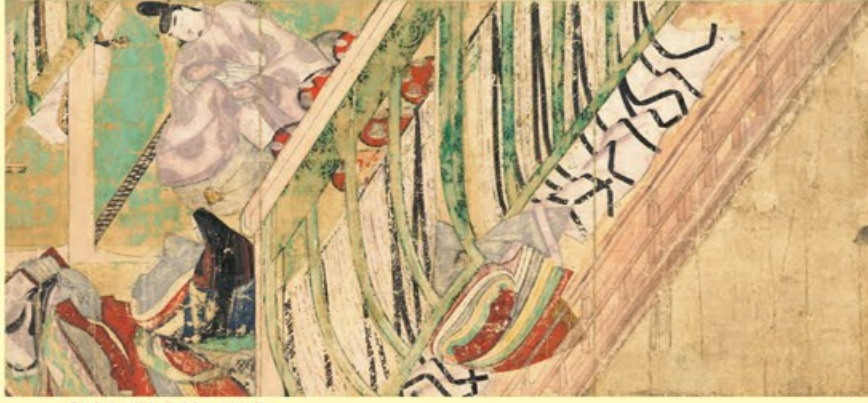
〔国宝〕源氏物語絵巻 柏木三 平安時代・12世紀 愛知・徳川美術館蔵 東京 薫を我が子として抱く源氏。苦悩する内面を不安定な構図が強調します