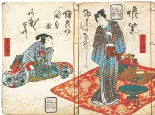
修紫田舎源氏 柳亭種彦作・歌川国貞(三代豊国)画 江戸時代・文政12～天保13年(1829～42) 東京国立博物館蔵 京都 東京 光源氏ならぬ、足利光氏の栄華を描いた大人気・長編パロディ小説

出版文化の発達とともに、「源氏物語」は江戸のひとに広く親しまれる物語となりました。登場人物や場面を当世風俗に置き換えて楽しむ浮世絵が数多く生まれ、知的な読み解きの遊びが広がります。江戸時代後期には、翻案小説「修紫田舎源氏」が大ベストセラーとなり、主人公・足利光氏を描く源氏絵が人気を博しました。この「源氏ブーム」は江戸後期の出版界を大きく動かし、その勢いは明治の浮世絵へも引き継がれていきます。