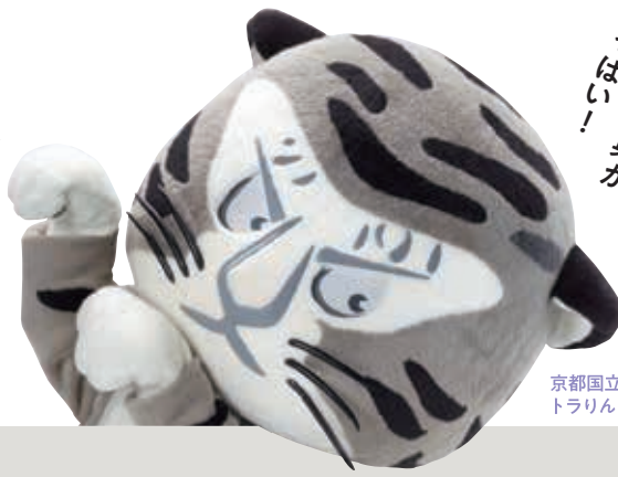
京都国立博物館公式キャラクター トラリン