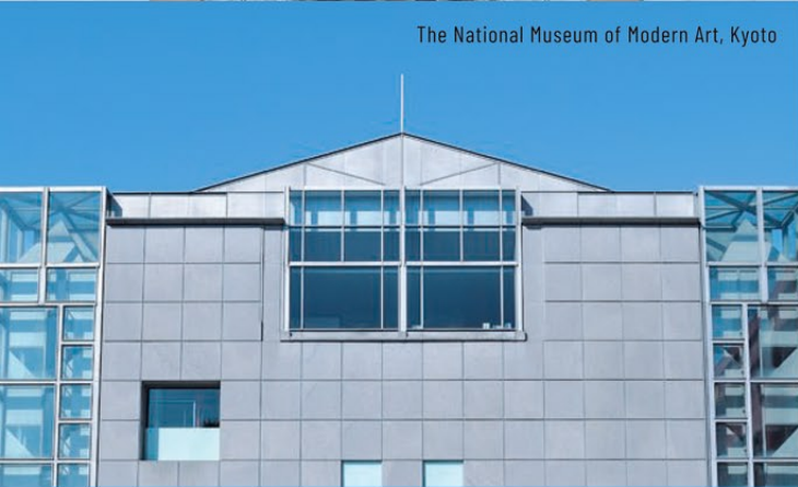
The National Museum of Modern Art, Kyoto