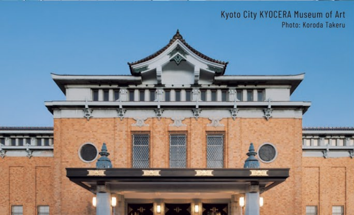
Kyoto City KYOCERA Museum of Art