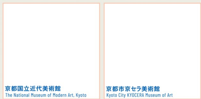
京都国立近代美術館 The National Museum of Modern Art, Kyoto