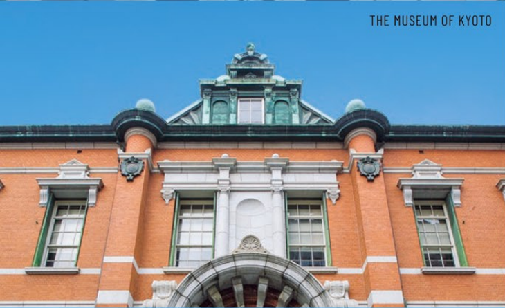
THE MUSEUM OF KYOTO