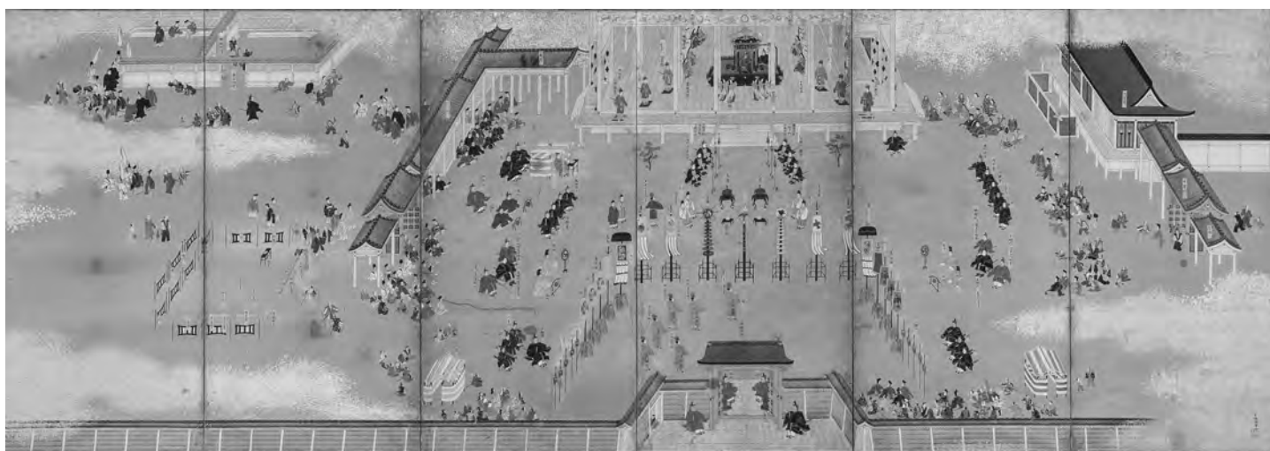
灵元天皇即位·后西天皇禅位图屏风 右扇 狩野永纳绘 江户时代 17 世纪 京都国立博物馆藏 后期展示