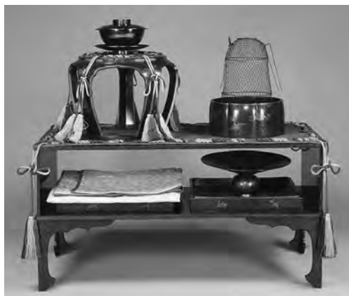
飞香舍仪式用品 蒔绘螺钿飞鹤衔松枝纹两段式橱柜、香木枕（上） 蒔绘螺钿飞鹤衔松枝纹两段式架格（下） 江户时代 宽政6年（1794）或者安政2年（1855） 东京国立博物馆藏 通期展示