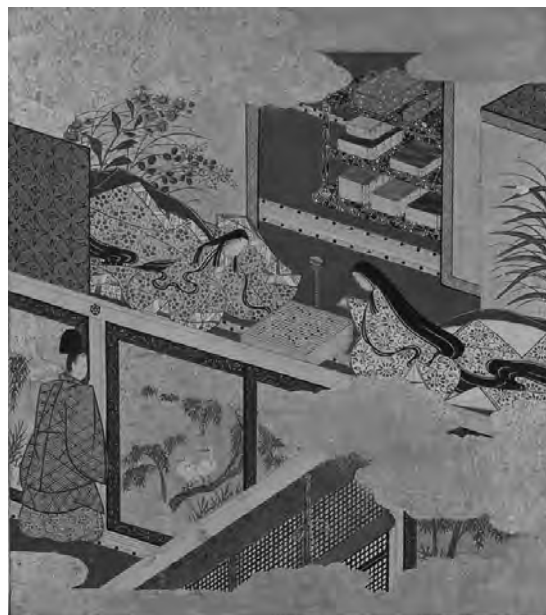
平安时代的贵族生活

重要文化财 源氏物语画帖 四帖中的甲帖 空蝉 绘画 土佐光吉、长次郎 词书 后阳成天皇等人 桃山时代 17世纪 京都国立博物馆藏 通期展示