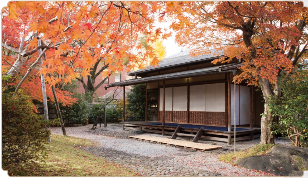
京都国立博物館 茶室「堪庵」