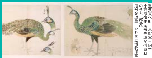
重要文化財 鳥獣写生図巻 小西玄米氏 彫光琳園傑作 のうちの部分 京都国立博物館蔵 尾形光琳筆