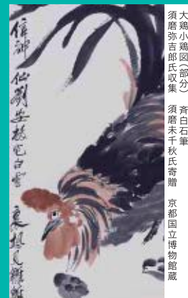
大鶏小徳園(部分) 青白石筆 須磨弥吉郎氏取集 須磨末千秋氏寄贈 京都国立博物館蔵

詳しくはこちら Please scan this QR code for details