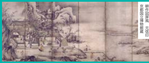
掛屏風 元信印 京都国立博物館蔵