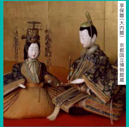
享保雛(大内雛) 京都国立博物館蔵