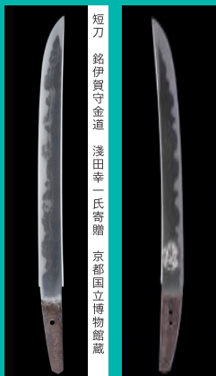
短刀 銘伊賀守金道 浅田幸一氏寄贈 京都国立博物館蔵 短刀 銘日州住信濃守国広作/天正十九年二月吉日 加藤静允氏寄贈 京都国立博物館蔵