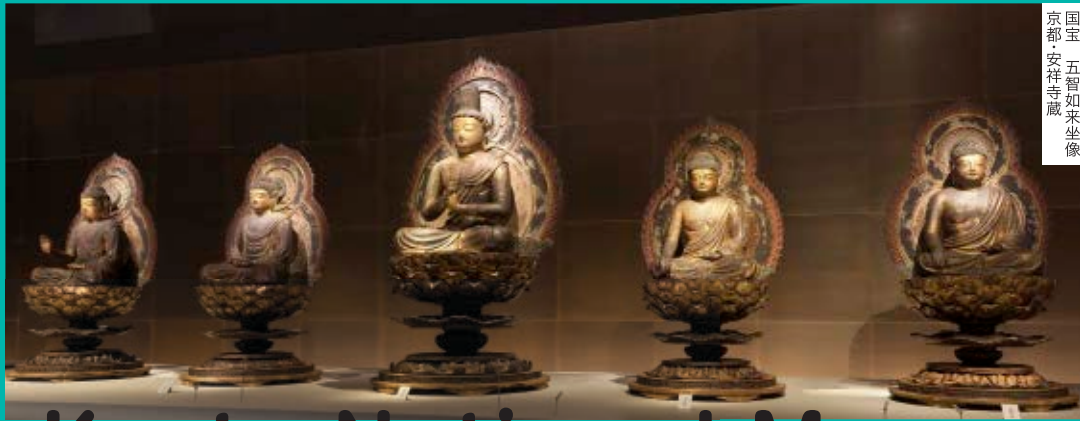
国宝 五智如来坐像 京都・安福寺蔵