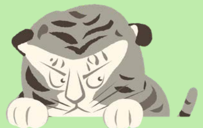
京都国立博物館公式キャラクター トラりん

「博物館は静かすぎて子連れで行きづらい」「子どもに博物館は難しそう」 そんな思いをお持ちの皆様が、リラックスして過ごせるような1日です。 親子での博物館デビューや夏休みの自由研究に、ぜひお気軽にご来館ください。