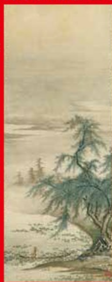
国宝 周茂叔愛蓮図 狩野正信筆 室町時代(15世紀) 福岡・九州国立博物館