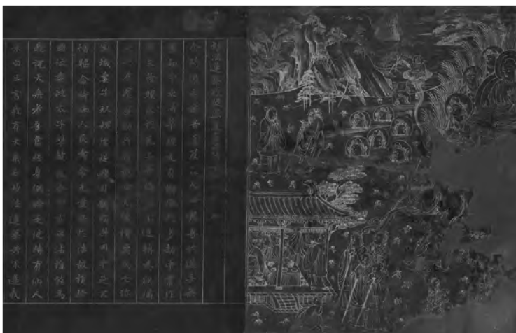
重要文化财 蓝纸银字《法华经》卷第五 卷首 平安时代 10世纪 滋贺 延历寺藏(卷第五的展出期间为4月12日-5月1日)