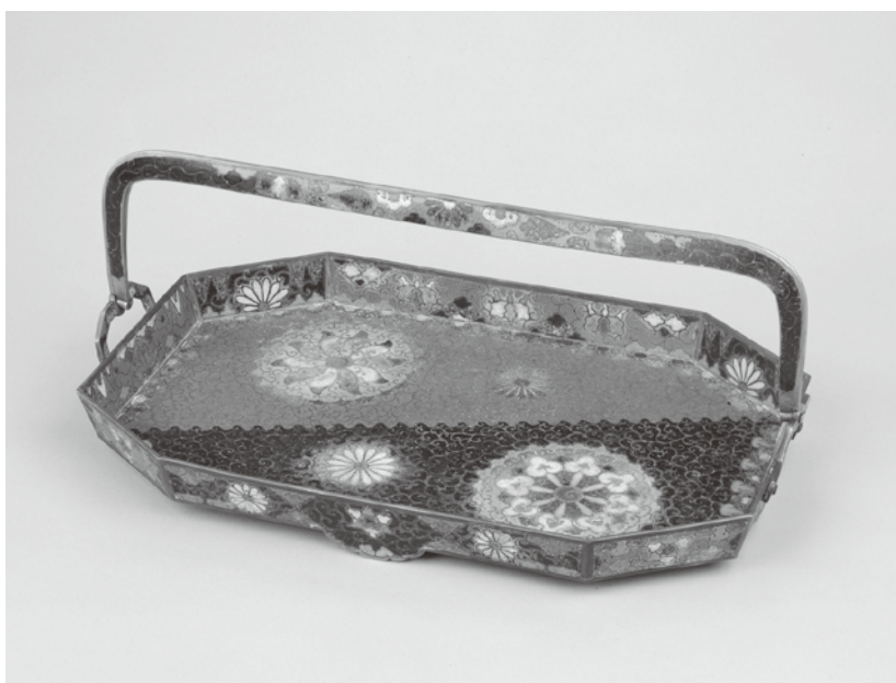
図1 七宝唐花文手付盆 江戸時代 京都国立博物館蔵

日本における七宝そのものの発生は比較的早く、現存する作例としては飛鳥時代の牽牛子塚古墳より出土した「七宝亀甲形座金具」や、奈良時代の正倉院宝物「黄金瑠璃鈿背十二稜鏡」を挙げることができます。また、厳密な意味での七宝ではありませんが、藤ノ木古墳から出土した「金銅装鞍金具・後輪」の取手には、熱せられてまだ柔らかい状態のガラスを粘土のようにこねて押付けた装飾が施されています。釉薬と近い成分であるガラス製品も古代から生産されているため、当時の人々にとっても比較的なじみ深いものだったのかもしれませんが、しかしながら、それ以降、直接的な継続関係にある作品はほとんど生まれず、日本における七宝の製作はここで一旦途絶えてしまったと考えられています。