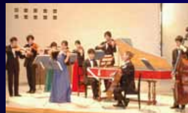
テレマン室内オーケストラ