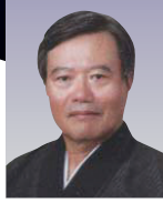
西江喜春 (人間国宝)