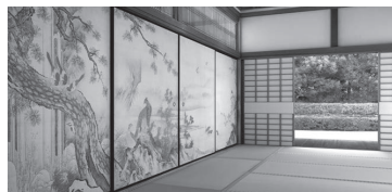
『よみがえる風景 —大徳寺大仙院の襖絵—』 撮影協力：大徳寺大仙院 企画：京都国立博物館 制作：丹青社、凸版印刷

かつて大徳寺大仙院のために狩野元信や相阿弥によって描かれた方丈の襖絵。現在は掛軸の状態で京都国立博物館に寄託されている32幅を、最新のCGで方丈の空間にダイナミックに再現。作品が描かれた時代へ、時を超えてご案内します。