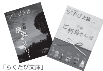
参考イメージ：「らくたび文庫」