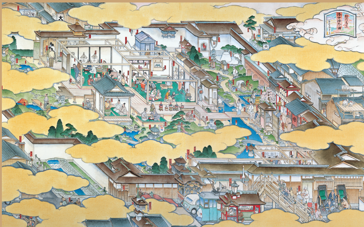
山口晃|邸内見立 洛中洛外圖 | 2007 | カンヴァスに油彩、水彩、墨 | 80×130 cm