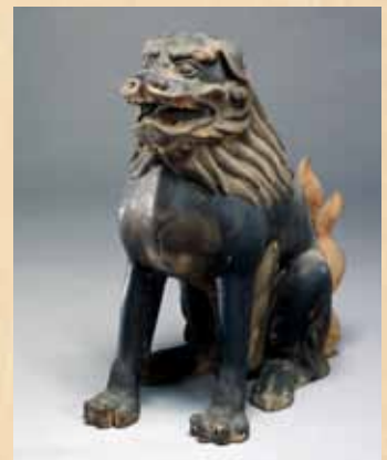
《獅子・狛犬(峰定寺伝来) 京都国立博物館》

獅子、狛犬ともに百獣の王ライオンの姿を写したもので、頭上に一本の角のある方を狛犬、無い方を獅子と呼びます。エジプト、中東地域では写実的なライオンが造られましたが、生息地から遠く離れた中国では姿が変わって唐獅子となり、それが日本に伝わりました。平安時代以降神社や寺院の入り口、あるいはお堂に置かれ、境内や神仏の像を守護する役を担ったのです。10対ほどの獅子・狛犬を並べた空間をおたのしみください。