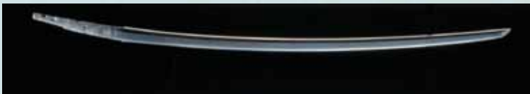
《重要文化財 太刀 菊御作 京都国立博物館》

この特集陳列では、後鳥羽上皇が御自ら手がけたとされる太刀「菊御作」、斬りつけた真似をするだけで相手の骨が砕けるという伝説を持つ「薙刀直シ刀(名物骨喰藤四郎)」(重文、豊国神社蔵)をはじめ、桶狭間の戦いで織田信長が戦利品として手に入れた「刀(名物義元左文字)」(重文、建勲神社蔵)、坂本龍馬所用の「刀 銘吉行」(京都国立博物館蔵)など、ドラマティックな歴史を持つ名刀の数々をご紹介します。作品に秘められた歴史とあわせて、奥深い刀剣の美の世界をお楽しみください。