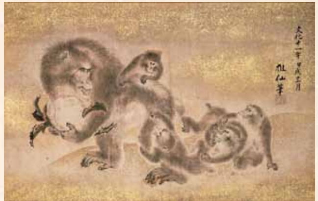
《猿図絵馬 森仙筆 兵庫・柿本神社》

2016年の干支は申です。これにちなんで、年末から新春にかけての京都国立博物館では、猿を描いた絵画や、猿をモチーフとした工芸品をご紹介します。日本や中国において親しまれてきた猿の多彩なイメージをぜひお楽しみください。