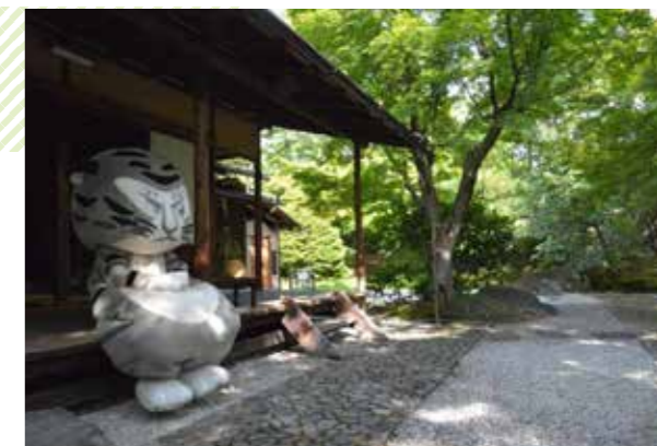
お庭を眺めながら一服(イメージ)