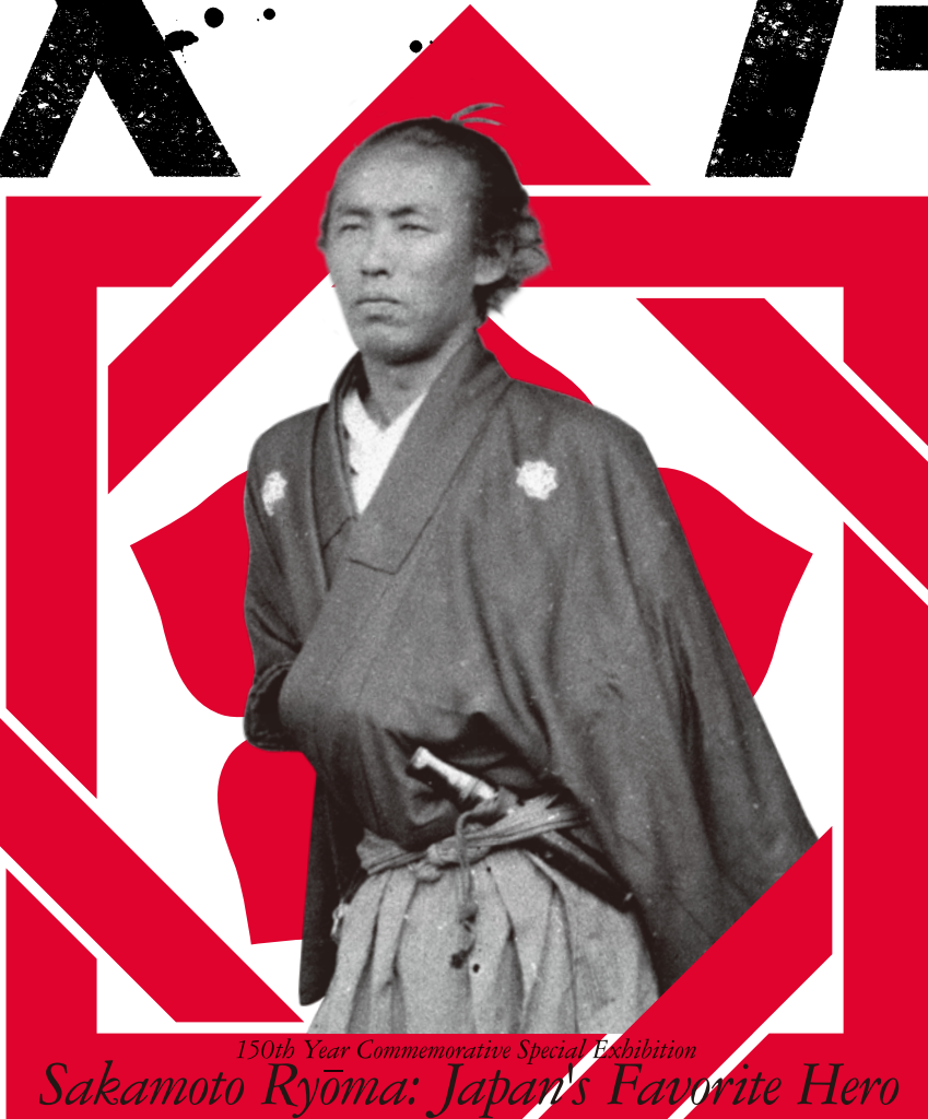
150th Year Commemorative Special Exhibition Sakamoto Ryōma: Japan's Favorite Hero

2016 10.15 (土) - 11.27 (日) 京都国立博物館 [東山七条] 平成新館 [F.2F] Kyoto National Museum