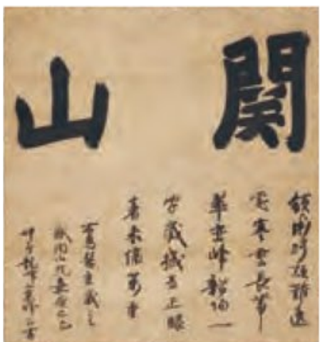
国宝 宗峰妙超墨蹟「関山」道号 鎌倉時代 嘉暦4年(1329) 京都・妙心寺(前期展示)

昭和27年3月29日指定 たっぷりと大きな文字に、禅僧の揺るがぬ力強い精神が宿る。日本最大の禪寺、妙心寺の根幹をなす書であり、我が国の禪宗文化を代表する至宝。