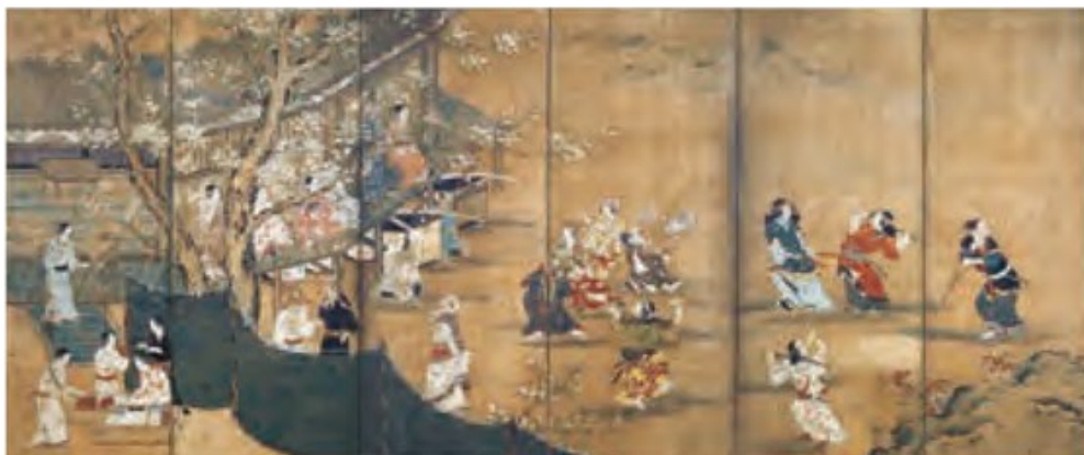
国宝 花下遊楽図屏風 狩野長信筆 桃山時代（17世紀）東京国立博物館（9月7日～9月12日展示）※展示は1週間のみ