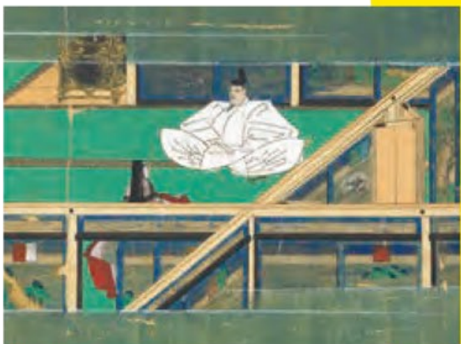
皇室の至宝 春日権現験記絵 卷二(部分) 絵:高階陸兼筆 詞書:廣司基忠ほか筆 鎌倉時代 延慶2年(1309)頃 東京・宮内庁三の丸尚蔵館(通期展示<卷二:前期展示、卷七:後期展示>)

鎌倉絵巻の至宝。藤原一門の氏神である奈良の春日社に奉納されたもので、京の公家文化の高みを鮮やかに示す。流出などの受難を経つても今日、20巻全てがそろって残る。