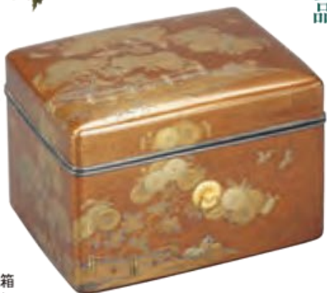
昭和30年6月22日指定 京の天皇家や将軍らがそろって奉納した、最高級の神宝の数々。南北朝時代の比類ない工芸品であり、化粧道具を入れた愛らしい手箱は、当時の雅な生活文化の香りも伝える。