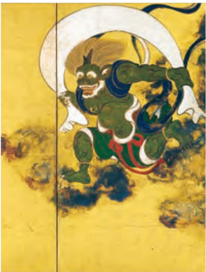
国宝 風神雷神図屏風(右隻 部分) 俵屋宗達筆 江戸時代(17世紀) 京都・建仁寺(8月24日~9月5日展示) ※展示は2週間のみ

文化財保護法の制定から約七十年。いにしえより世に名高い名宝から、学術の進歩によって新たに見出されたものまで、今日までに国指定品となった美術工芸品は国宝八九七件、重要文化財一〇八〇八件(令和三年三月段階 ※重要文化財の数は国宝を含む)の多きに上ります。本章では特にその精華ともいへば、京都の土地や人ゆかりの国宝の数々を、ご覧いただきます。