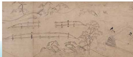
重要美术品 北野本地绘卷断简(局部) 京都国立博物馆藏