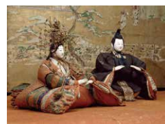
古今雏 玉城芳江氏捐赠 京都国立博物馆藏

在日本,每年的3月3日是祈愿女孩健康成长的节日“雏祭”,在这一天前后,有女孩的人家会在家中摆放雏人偶。