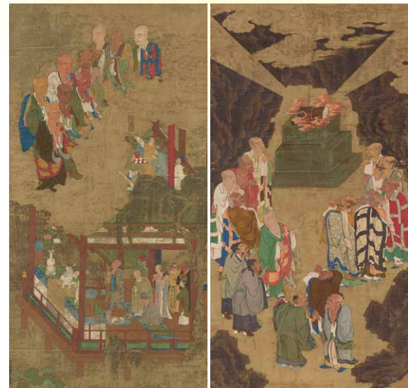
重要文化财 五百罗汉图 吉山明兆绘/京都 东福寺藏 右:第1号幅 10月7日(六)~10月22日(日)展出 左:第45号幅 11月21日(二)~12月3日(日)展出

东福寺是日本最杰出的禅宗文化殿堂,拥有包含古建筑在内的大量珍贵文物。本次特展汇集东福寺的巨型佛像与书画精品,展现其丰富的历史与文化。值得一提的是,被奉为“画圣”的佛画师明兆绘制的《五百罗汉图》在修复后首次公开,是本次特展的必看之作。