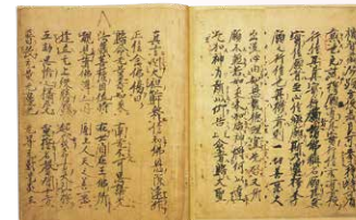
国宝《教行信证》坂东本 亲鸾书/京都 西本愿寺藏