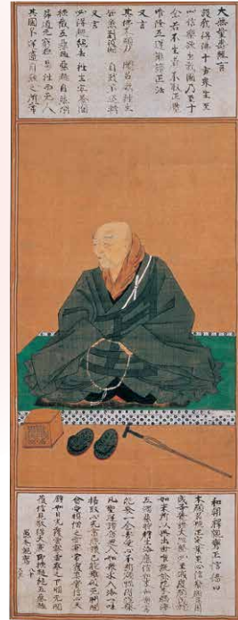
国宝 亲鸾圣人像(安城御影摹本)局部 京都 西本愿寺藏 (3月25日~4月2日展出)