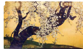
樱花图“樱花图/松与藤花图”之中 望月玉泉绘/京都 东本愿寺藏