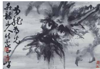
升龙墨意(须磨帖) 高奇峰绘 须磨弥吉郎氏收集、须磨未千秋氏捐赠 京都国立博物馆藏

又到了京都国立博物馆每年惯例举办的新春生肖专题展!2024年的生肖是辰(龙),博物馆里的龙们整装待发,要与大家一起过一个热热闹闹的龙年。期待无论是小朋友还是大朋友,都能够享受这个展览!