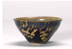
吉州窑玳瑁釉盏(玳瑁天目) 京都国立博物馆藏