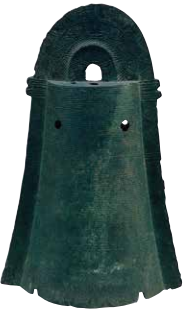
重要美术品 流水纹铜铎 京都国立博物馆藏